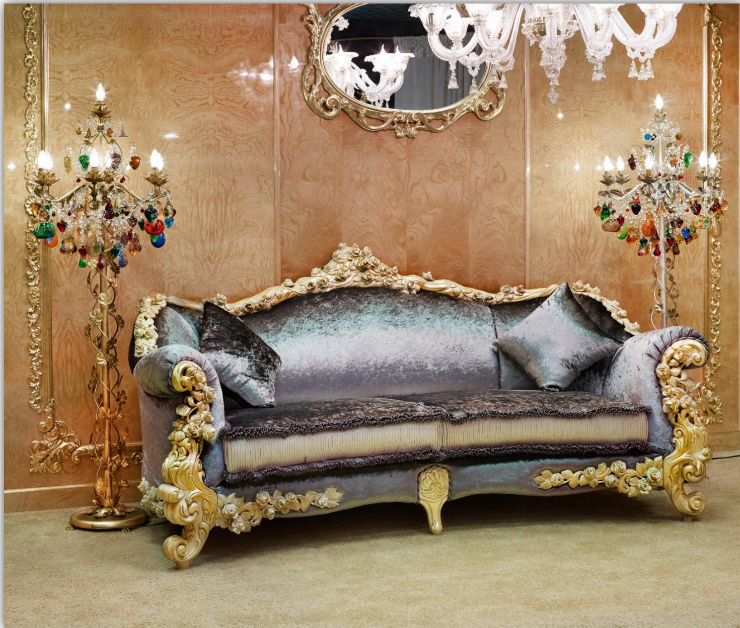
Колекция GOLDEN ROSES