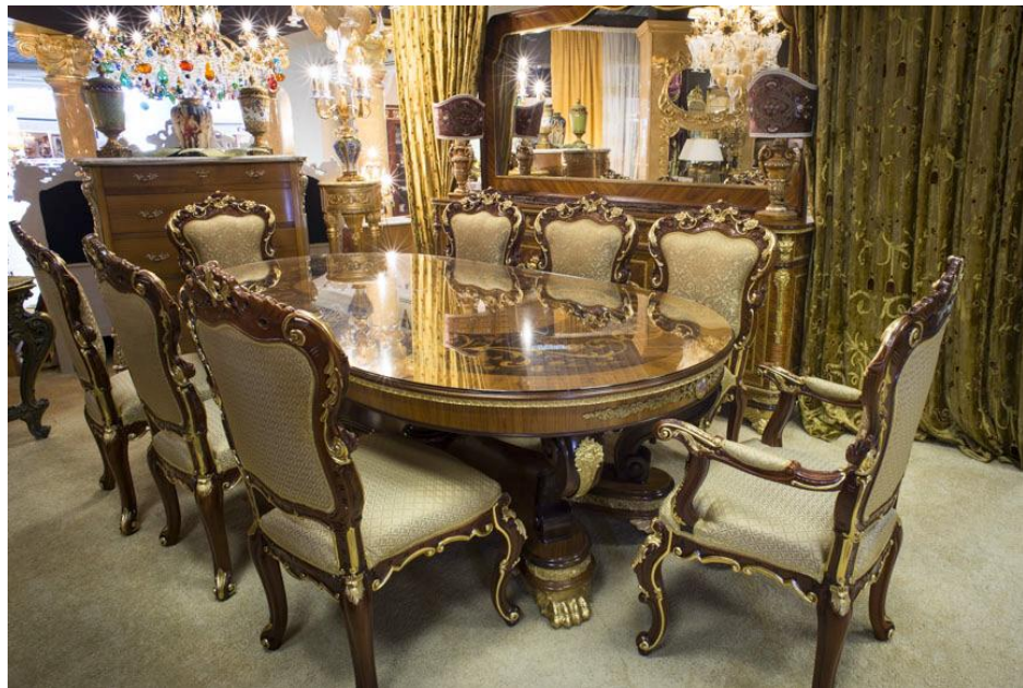
Коллекция GRAN DUCATO