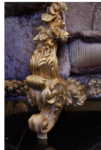
Коллекция GOLDEN ROSES